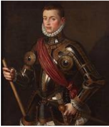
ohn of Austria in armour. Alonso Sánchez Coello (1567)