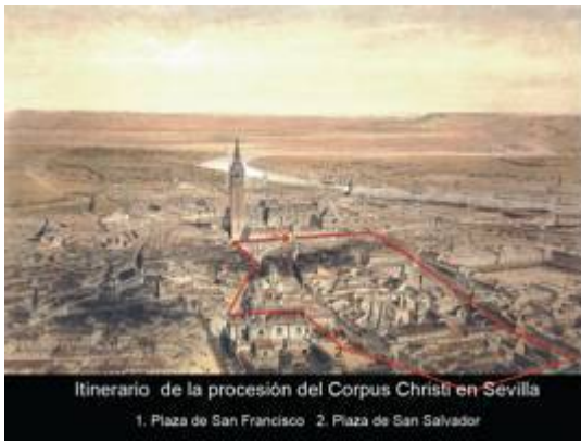
Itinerary of the Corpus Christi procession