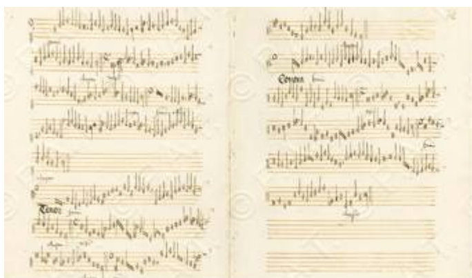
"Kyrie eleison". [ Missa de Beata Virgine ]. Henricus Tik. I-TRbc 89, fols. 366v-367r