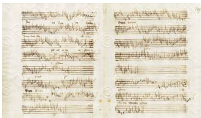
"Sanctus". [ Missa de Beata Virgine ]. Henricus Tik. I-TRbc 90, fols. 348v-349r