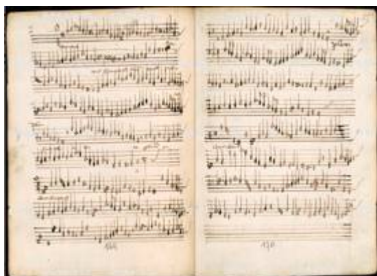
"Sanctus". [ Missa de Beata Virgine ]. Henricus Tik. CZ-Pst D.G.IV.47, fols. 84v-85r