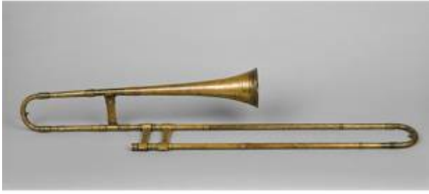
Sackbut. Joerg Neuschel (Nuremberg, 1557)