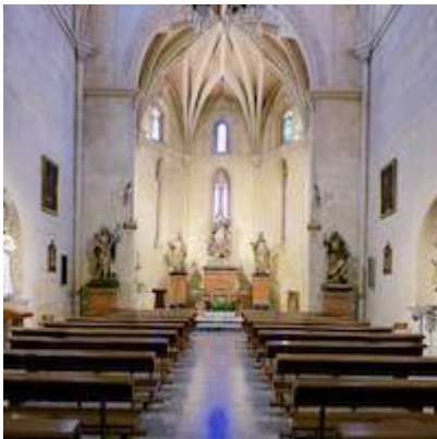
Old convento of Santiago de la Espada.