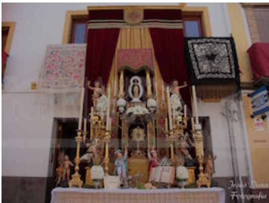
Altars and ornaments. Procession of Corpus Christi in Triana (2018).