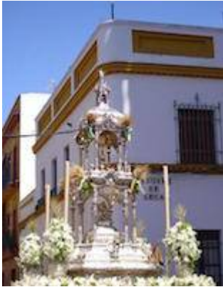
The Monstrance of the Corpus Christi procession in Triana (1712-1716).