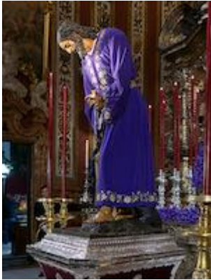
Our Father Jesus of the Passion. Juan Martínez Montañés (c. 1615)