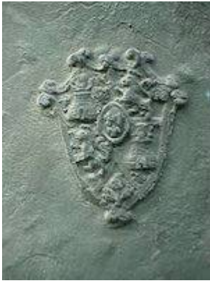
Santa Lucía's bell. Catedral de Sevilla. Antón López / Antonio Márquez.