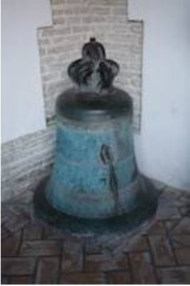
Bell of the church of Santa Bárbara. Écija (Sevilla). Antón López (1411).