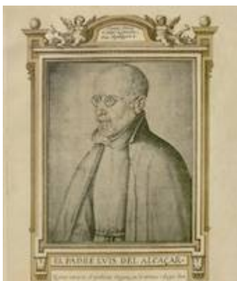
Retrato de Luis de Alcázar. Francisco Pacheco. Libro de descripción de verdaderos retratos de ilustres y memorables varones