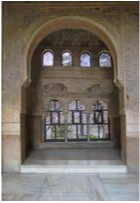
Chapel of the convent of San Francisco de la Alhambra (inside).