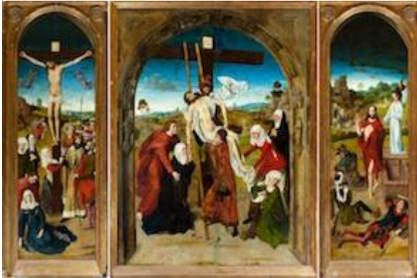
Triptico de la Pasión. Dieric Bouts