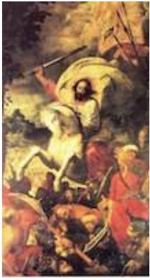
Santiago en la batalla de Clavijo. Juan de Roelas (1609). Santiago's chapel