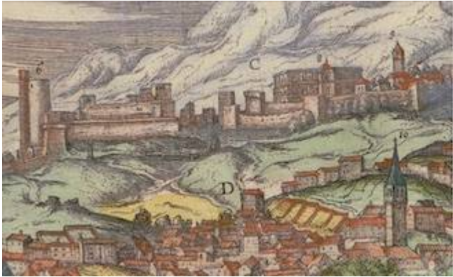
Church of Santa María de la Alhambra [9]. Joris Hoefnagel (1565)