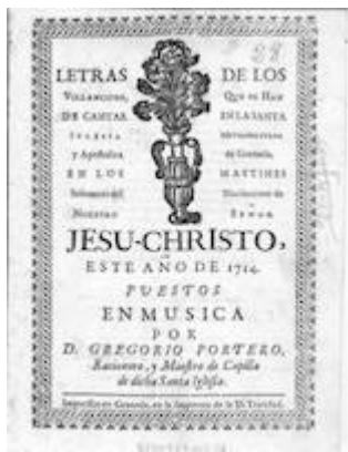
Letras de los Villancicos que se han de cantar en la ... Iglesia Apostólica, y Metropolitana de Granada, año de 1714. Granada, Imprenta de la Santísima Trinidad, 1714