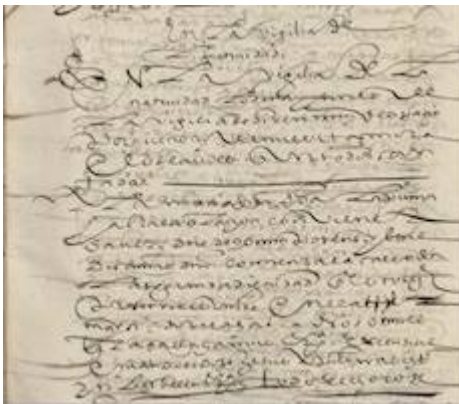
Consueta de Granada . fol. 48r