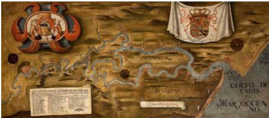
Curso del río Guadalquivir desde Sevilla hasta su desembocadura. Anónimo (siglo XVIII)