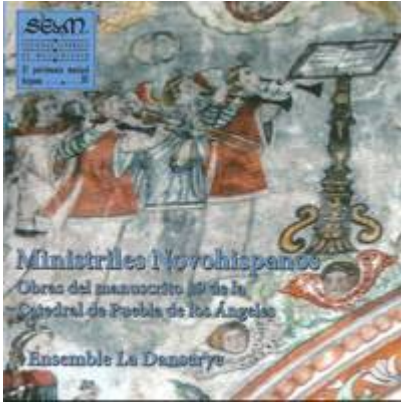
Batalla, 4v. Clément Janequin. Ministriles Novohispanos . Obras del manuscrito 19 de la catedral de la Puebla de los Ángeles. Ensemble La Danserye. SEdM, 2013.

https://www.historicalsoundscapes.com/recursos/2/5/batalla_-_parte_1.mp3