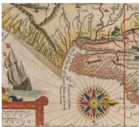
Río de la Plata. Jan Huygen Van Linschoten (1596)