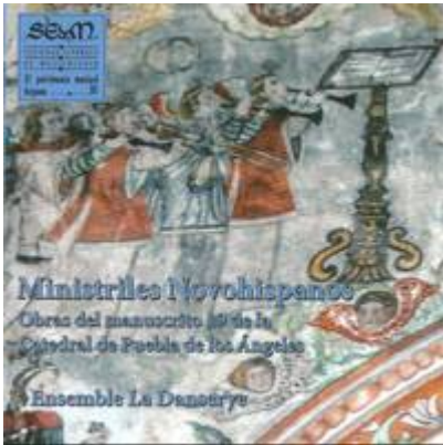
Batalla, 4v. Clément Janequin. Ministriles Novohispanos . Obras del manuscrito 19 de la catedral de la Puebla de los Ángeles. Ensemble La Danserye. SEdeM, 2013.

https://www.historicalsoundscapes.com/recursos/2/5/batalla_-_parte_1.mp3