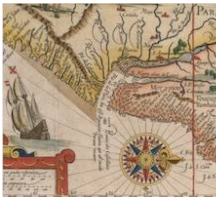
Río de la Plata. Jan Huygen Van Linschoten (1596)