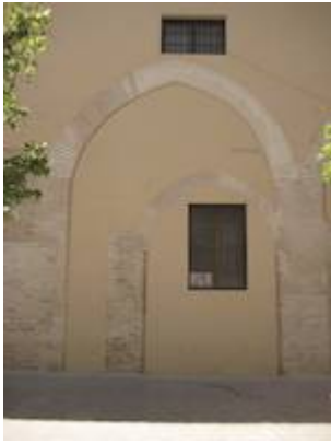
Remains of the church of San Justo y Pastor (3).