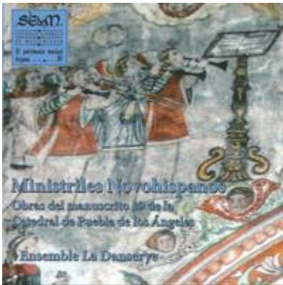
Nobis datus , 5vv (ff. 63v-65r). Rodrigo de Ceballos. Ministriles Novohispanos . Obras del manuscrito 19 de la catedral de la Puebla de los Ángeles. Ensemble La Danserye. SEdeM, 2013.

https://www.historicalsoundscapes.com/recursos/1/5/nobis-datus-ceballos.mp3