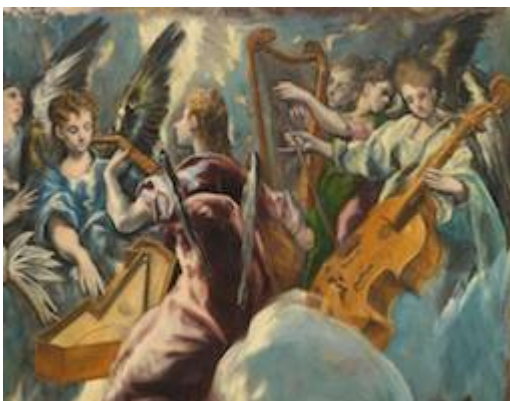
The Annunciation (detail). El Greco (1597-1600)