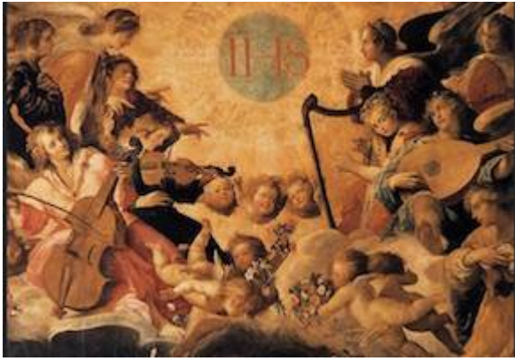
La circuncisión de Cristo. Juan de Roelas (1604-1605)