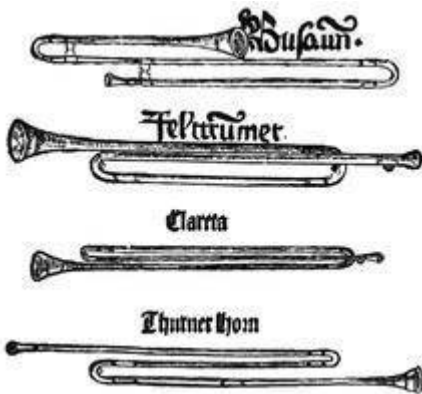
Trumpets. Musica getuscht und angezogen . Sebastián Virdung (1511)