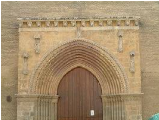
Facade of the church of Santa Marina.