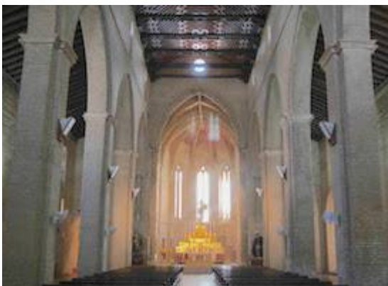
Inside view of the church of Santa Marina.