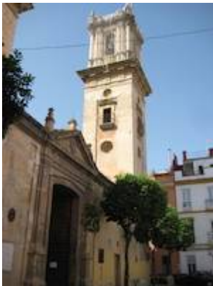
Church of San Bartolomé (2). Picture by Juan Ruiz Jiménez