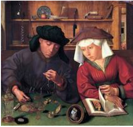
The Money Changer and His Wife . Quentin Matsys (1514)