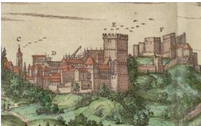
Alhambra (detail). Joris Hoefnagel (1563)