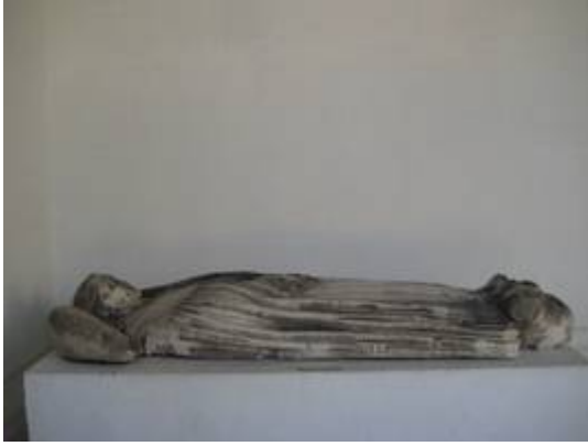
Mausoleum of fray Alberto Casaus (1). Convent of San Pablo (16th. century). Archaeological Museum of Seville.