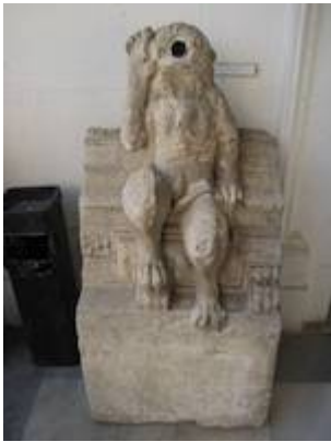
Gargoyle (2). Convent of San Francisco Casa Grande (15th. century). Archaeological Museum of Seville.