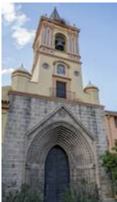
Facade of the church of San Isidoro.