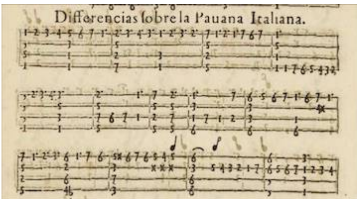
Diferencias sobre la pavana italiana . Antonio de Cabezón. Libro de cifra nueva para tecla, harpa y vihuela (1557), fol. 190v