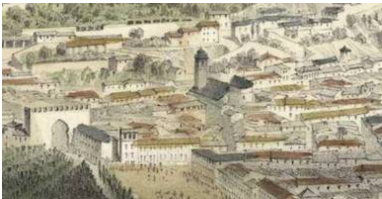
Church of San Andrés. Granada. Granada. Alfred Guesdon (1854)