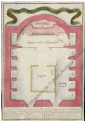
Planta de la Iglesia mayor de Orán (1734)