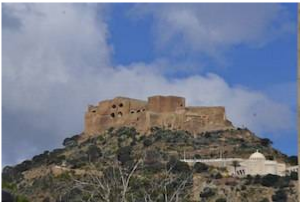
Santa Cruz castle.