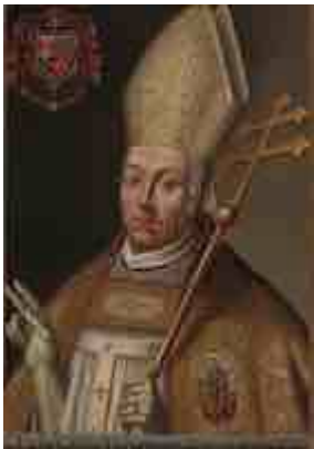
Retrato del cardenal Portocarrero en la sala capitular de la catedral de Toledo