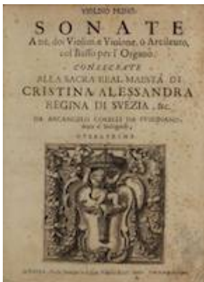
Edición de las Sonatas op. 1 de Corelli de 1681