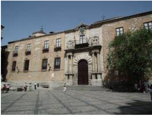
Fachada principal del palacio arzobispal