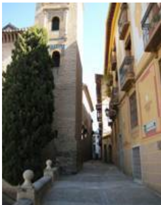
Calle Santa Ana.