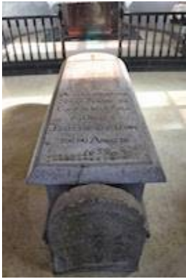
Tumba de San Francisco Javier (Isla de Shangchuan)