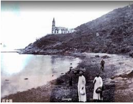
Capilla de San Francisco Javier desde la playa (Isla de Shangchuan)