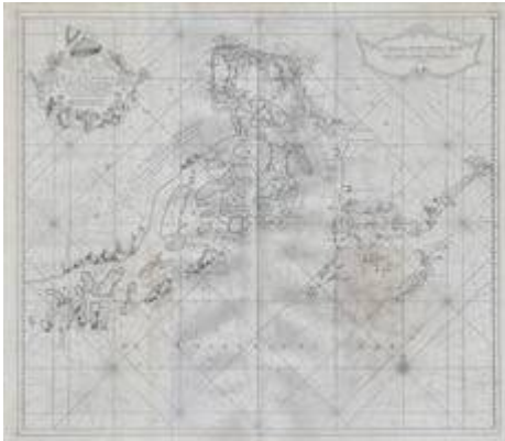
"Kaat van het in en opkomen van de Rivier van Quantong". Secret Atlas of the Dutch East India Company . Johannes van Keulen (siglo XVIII)