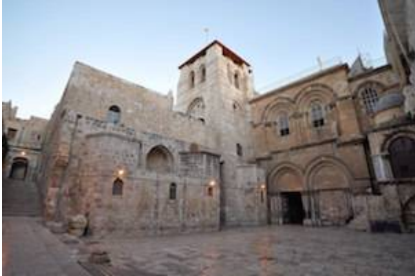
Iglesia del Santo Sepulcro