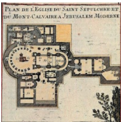
Plano de la iglesia del Santo Sepulcro. Alain Manesson Mallet (1683)