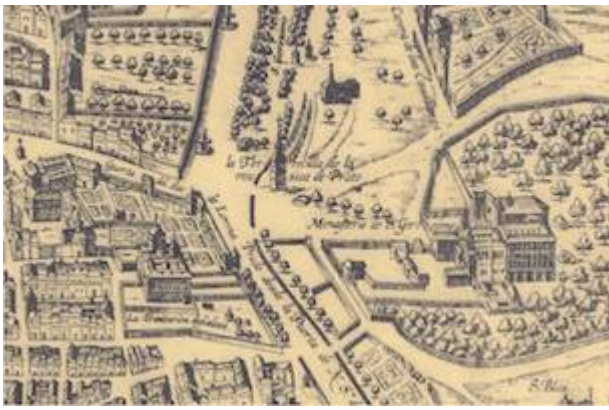
"La torrecilla de la música del Prato". La Villa de Madrid Corte de los Reyes Católicos de España . [Antonio Mandelli, 1622] F. de Wit Escudit