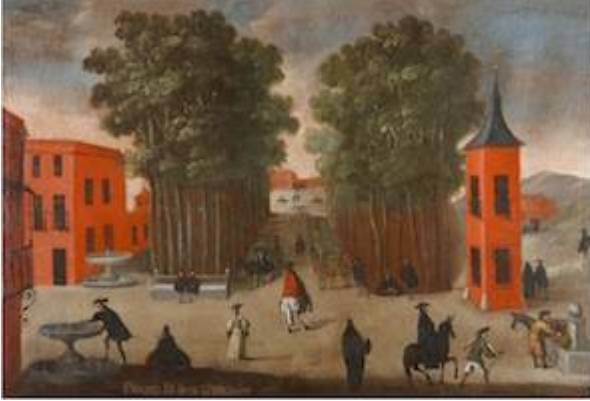
El Prado de San Jerónimo . Anónimo (segunda mitad del siglo XVII)