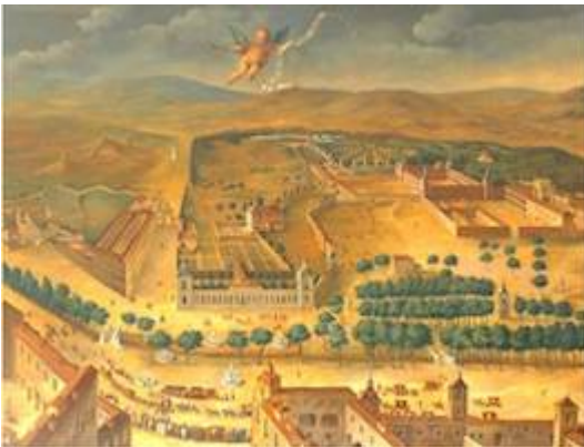
El Prado de San Jerónimo . Anónimo (finales del siglo XVII, copia de 1920)