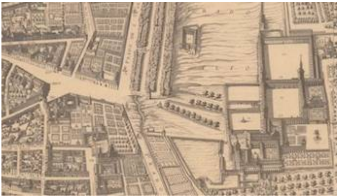
"Torrezilla del Prado" (nº 32). Nueva impresión de la Topographia de la Villa de Madrid descrita por Don Pedro Texeira, Año de 1656 .