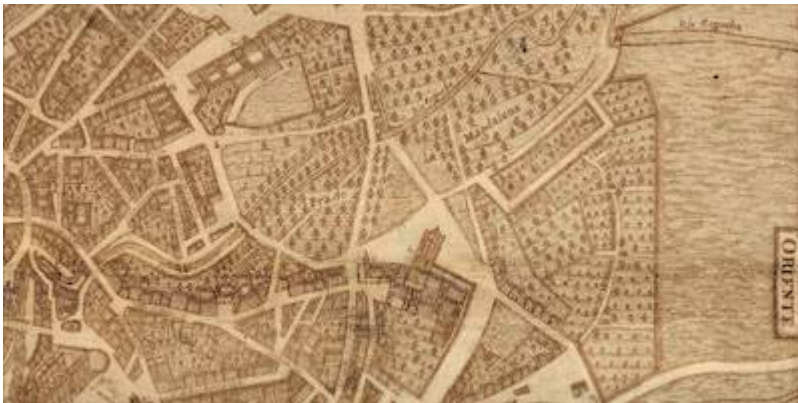
Plano de la ciudad de Valladolid en 1738 (detalle). Bentura Seco