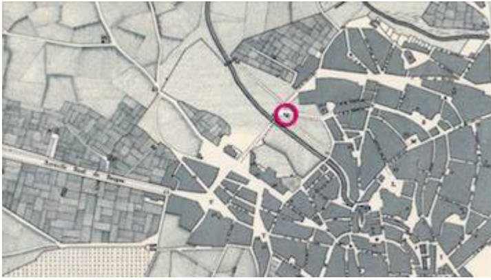
Plano de Valladolid (detalle). Victoriano de Ameller (1844)