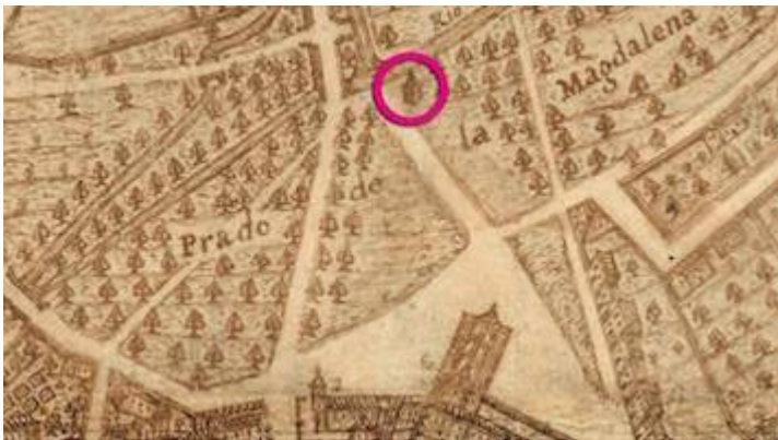
Casa de las Chirimías. Plano de la ciudad de Valladolid en 1738 (detalle). Bentura Seco