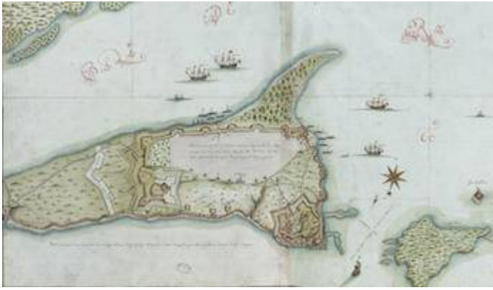
Mapa de la bahía de San Juan (Puerto Rico) –1678–