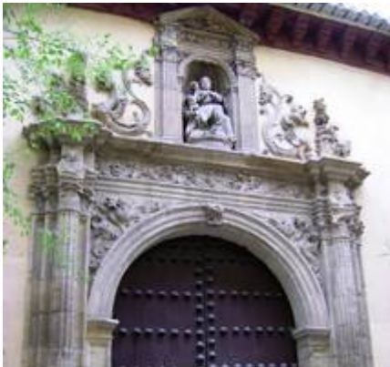
Iglesia de San Matías