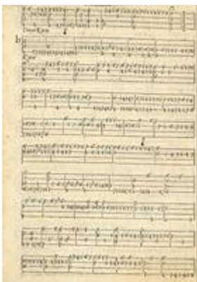
Tercer kyrie. Francisco Hernández Palero. Libro de cifra nueva para tecla, arpa y vihuela . Luis Venegas de Henetrosa (1557)