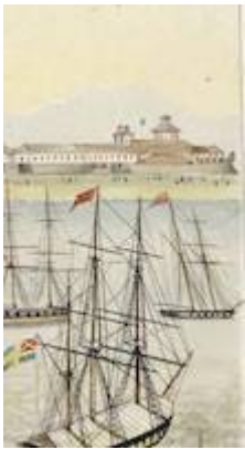
"La Compañía". Vistas de las Yslas filipinas y trages de sus abitantes . José Honorato Lozano (1847)