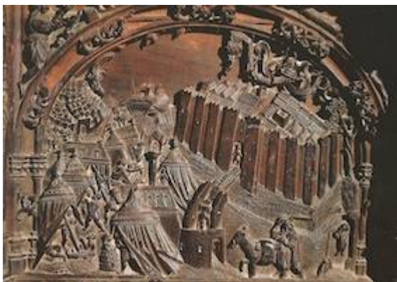
Real de Santa Fe. Sillería baja del coro de la catedral de Toledo. Rodrigo Alemán (1495)