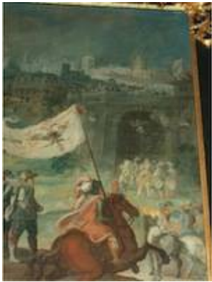
Entrada triunfal de Vaca de Castro en Cuzco (detalle 1)