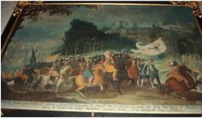
Entrada triunfal de Vaca de Castro en Cuzco