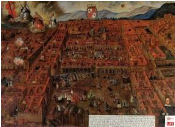
Vista de Cusco. Anónimo (1650)