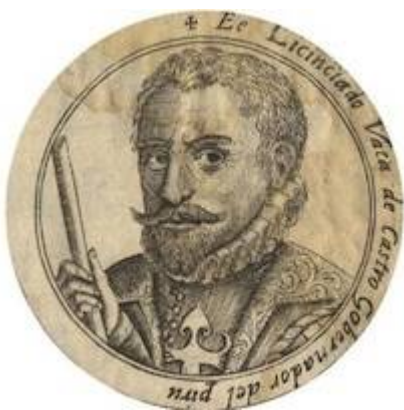
Retrato de Vaca de Castro