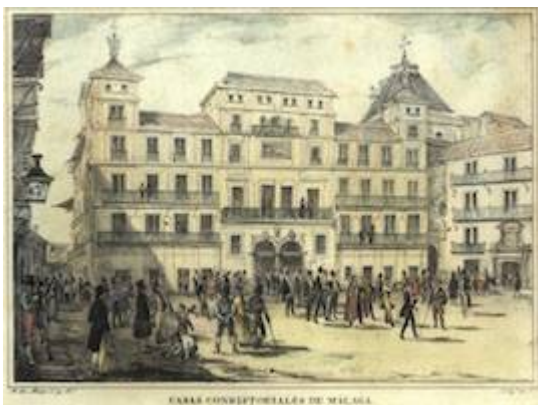
Casas Consistoriales. Manuel de Mesa y Francisco Pérez (1839)