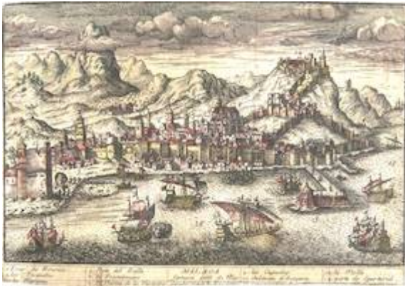
Málaga (finales del siglo XVII). Anónimo