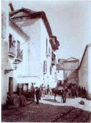
Molino de los Ribera. Calle San Juan de los Reyes