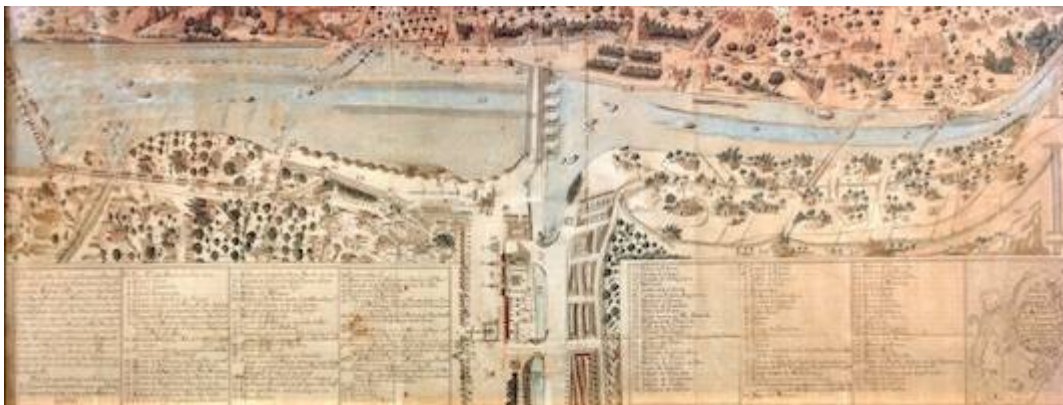
Diseño del Río Genil de Granada (1751)