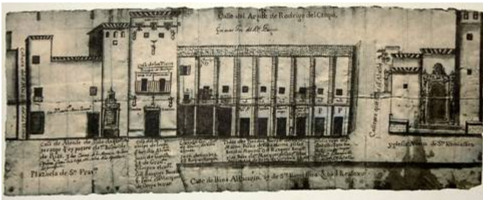
Ubicación de la antigua mezquita Ibn Gimara (siglo XVII)