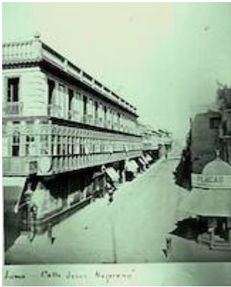
Calle de Jesús Nazareno