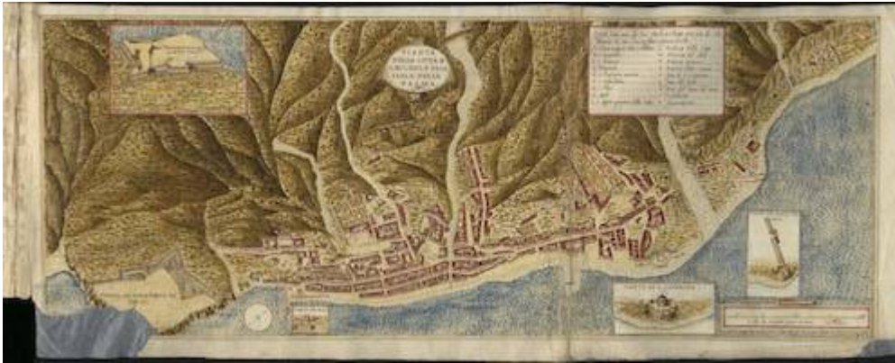
Descrittione et historia del regno de l'isole Canarie gia dette le Fortvnate. Leonardo Torriani. Biblioteca da Universidade de Coimbra, ms. 314, fol. 99r