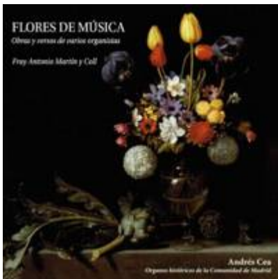
Ligaduras para la Elevación . Anónimo. Flores de Música. Obras y versos de varios organistas . Fray Antonio Martín y Coll. Organista: Andrés Cea. Sevilla, Lindoro, 2011

https://www.historicalsoundscapes.com/recursos/60/5/ligaduras-elevacion.mp3