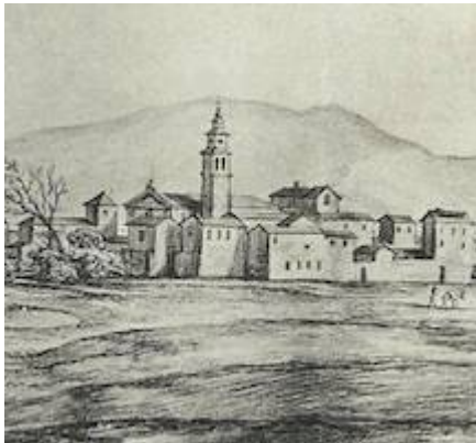
Colegiata de Nuestra Señora de la Encarnación. Santa Fe. Viaje de Cosme de Médicis por España y Portugal (1668-1669) . Lorenzo Magalotti