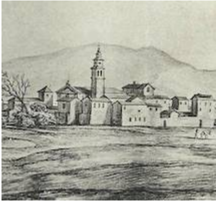
Colegiata de Nuestra Señora de la Encarnación. Santa Fe. Viaje de Cosme de Médicis por España y Portugal (1668-1669) . Lorenzo Magalotti