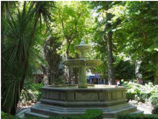
Fuente del convento de la Trinidad.