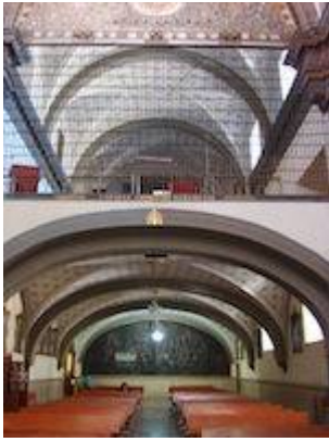
Coro del convento de la Santísima Trinidad