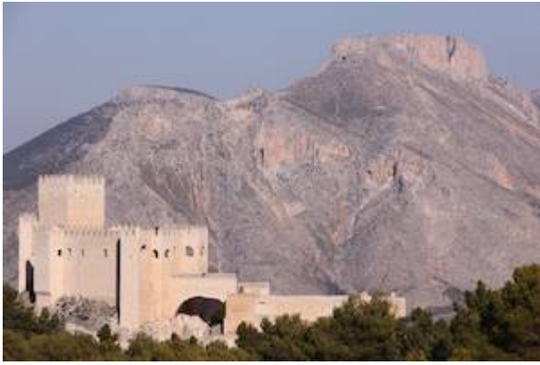
Castillo de Vélez Blanco