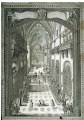
Las Cortes de Castilla juran a Felipe V (1701) en la iglesia de los jerónimos. Juan Bautista Berterham y Felipe Palota (1703)