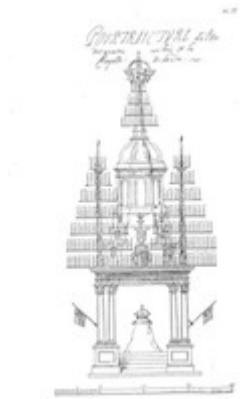
Túmulo funerario del rey Felipe II en la iglesia de San Jerónimo (1598)