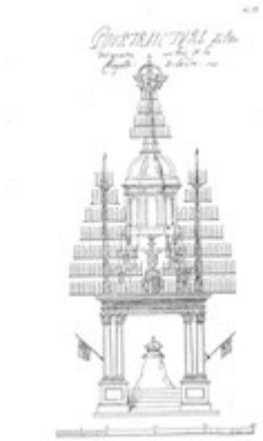
Túmulo funerario del rey Felipe II en la iglesia de San Jerónimo (1598)