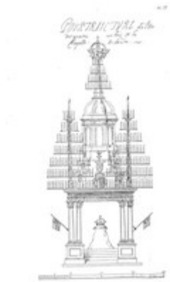
Túmulo funerario del rey Felipe II en la iglesia de San Jerónimo (1598)