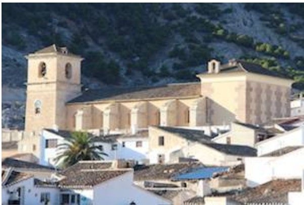
Iglesia de Santiago (Vélez Blanco)