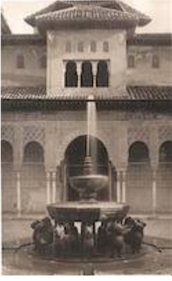
Fuente de los Leones antes de 1966