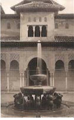
Fuente de los Leones antes de 1966